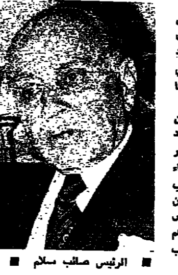
الرئيس صائب سلام